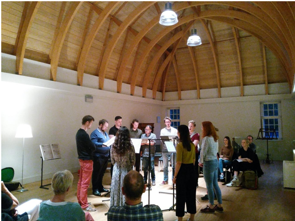
Workshop Franco-Vlaamse polyfonie uit originele bronnen , Huis van de Polyfonie, 24 april 2019

Het opzet en de doelstellingen kunnen als volgt worden geformuleerd: jonge musici maken kennis met de wereld van de Franco-Vlaamse polyfonie zoals die tot uiting komt in het Alamire-corpus. De hoge resolutie-beelden van de Alamire Foundation laten toe om rechtstreeks vanuit de vijftiende- en zestiende-eeuwse bronnen te zingen. Er wordt niet enkel aandacht besteed aan het lezen van de mensurale notatie, maar ook aan zangtechnieken die eigen zijn aan het zingen in vocaal ensemble. Door zich te bekwamen in gregoriaans, solmisatie en geïmproviseerd contrapunt, vergaren de deelnemers dieper inzicht in het repertoire. De composities komen uitsluitend uit de bewaarde Alamire-handschriften, met prominente componisten als Johannes Ockeghem, Pierre de la Rue, Josquin des Prez en Adriaan Willaert.