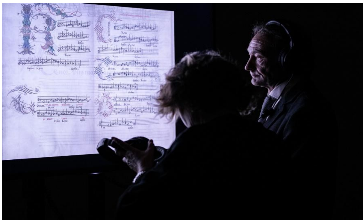
Multimedia bezoekersbegeleiding bij de tentoonstelling in Rome

De tentoonstelling die in 2015 onder het curatorschap van Bart Demuyt, David Burn en Manfred Sellink werd ontwikkeld en in de kathedraal van Antwerpen stond opgesteld, werd modulair geconcipeerd, met de bedoeling er internationaal mee te kunnen rondreizen: (a) panelen met de reproductie op ware grootte van opnames uit alle betrokken handschriften; (b) filmpjes op basis van de digitale beelden waarvan de scherpe details op hoogwaardige schermen worden geprojecteerd; (c) handschriften (waaronder alle in België bewaarde Alamire-codices), schilderijen en beeldhouwwerken; (d) de ervaringsgerichte en innovatieve media-installatie Speculum Musurgica; (e) een facsimile van het vandaag in Mechelen bewaarde Alamire-handschrift; (f) mediagidsen met informatie, beeldmateriaal en muziekopnames; (g) publicaties.