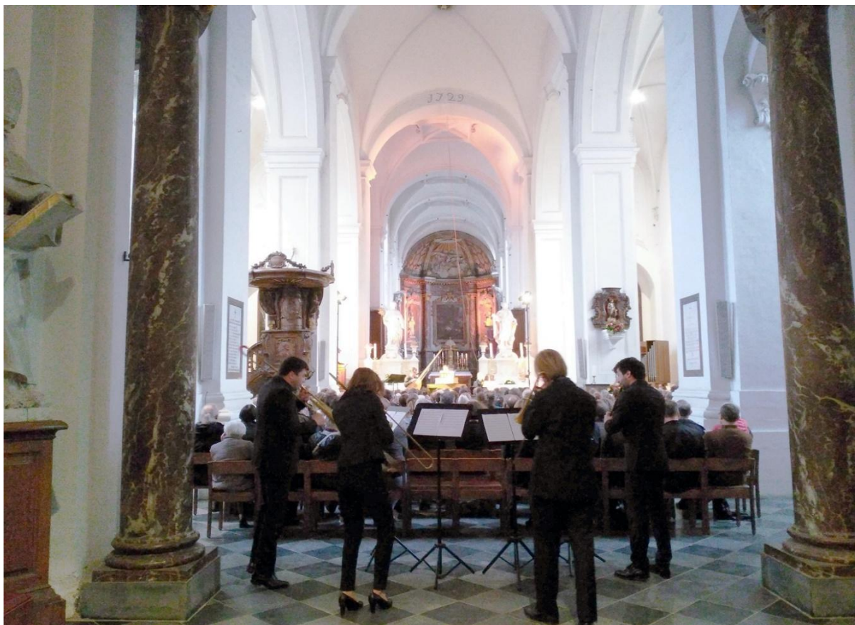
Passie van de Stemmen op 10 mei 2019 met het ensemble InAlto in de kerk van de Abdij van Park Heverlee

Het concept van Passie van de Stemmen bestaat uit een reeks voorjaarsconcerten. De uitvoeringen, die meestal plaatsvinden in de kerk van de Abdij van Park, worden geduid door middel van inleidende lezingen in het Huis van de Polyfonie en een uitgebreid programmaboek. In het kader van het festival worden ook workshops of fringe -activiteiten georganiseerd voor pre-professionele ensembles die zich toelleggen op de uitvoering van polyfonie.