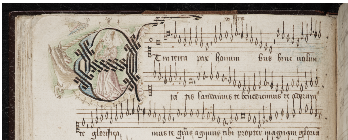
Brussel, KBR, ms. 5557, fol. 30v (detail)

In de voetsporen van Hare Majesteit Koningin Fabiola, die het Huis van de Polyfonie in 2011 opende, staat de Alamire Foundation sinds 2017 onder de Hoge Bescherming van Hare Majesteit Koningin Mathilde.